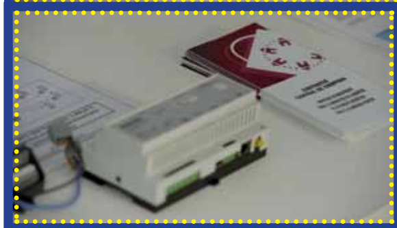
Divulgación del Plan de Eficiencia Energética de la Diputación de Castellón.

permita la importación directa de la información contenida en la factura que facilite la empresa comercializadora. De la misma forma, y ante un escenario en el que cada vez están más presentes los sistemas de gestión y smart cities, conviene decidirse por adquirir una herramienta tipo web y abierta a la integración con otros sistemas.