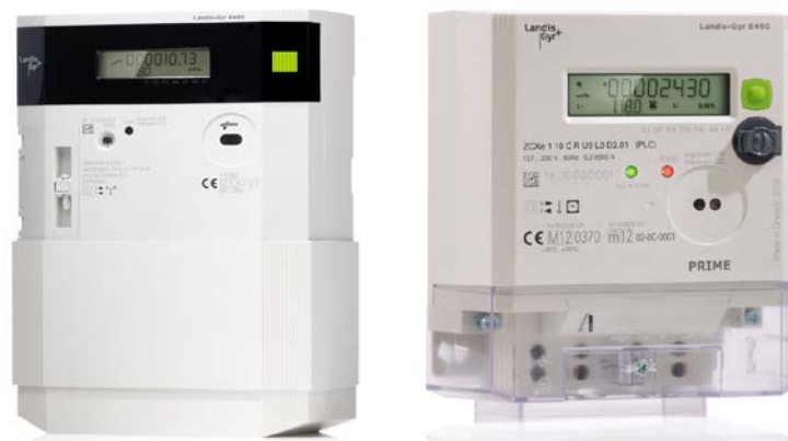
Fig. 3. Aspecto modelos contador inteligente (PRIME) Landis Gyr E450.