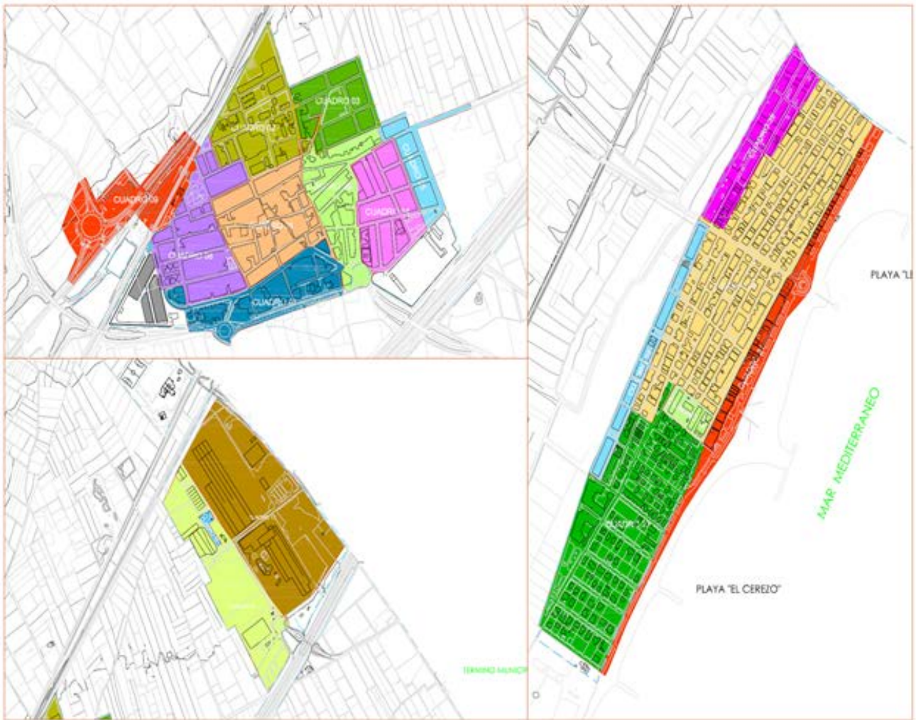
Fig. 1. Distribución por sectores de alumbrado del poblado interior del municipio.

Con este proyecto de renovación, se han ido sustituyendo tecnologías más tradicionales como las lámparas de vapor de sodio de alta presión y vapor de mercurio, instaladas a lo largo y ancho del término municipal hasta ese momento, por otra tecnología como es la de halogenuros metálicos. Las nuevas lámparas instaladas, si bien no son más eficientes en sí mismas que las anteriores, introducen una mejor reproducción de colores (presentan mayor IRC) y una tonalidad o color más agradable que sus predecesoras. Además, permiten utilizar nuevas ópticas reaprovechando los modelos existentes de luminaria. De este modo, mediante una buena redistribución del flujo luminoso y la consiguiente reducción de la contaminación lumínica se obtiene un nivel de alumbrado similar con un mejor rendimiento energético del conjunto y la pertinente reducción del consumo eléctrico. Finalmente, señalar que la progresiva disminución del coste de las tecnologías basadas en LED, principal inconveniente de las mismas hasta el momento y que hizo descartarlas como opción en la Auditoría Energética del 2013, ha hecho replantear la posibilidad de utilizar esta opción en alguno de los sectores de alumbrado que quedan por modificar y que van a ser reemplazados a lo largo de 2015 y 2016. El caso que aquí se presenta analiza la viabilidad económica de una mejora en la eficiencia de una instalación de este tipo considerando todos los citados factores: eficiencia energética de las lámparas y uso de ópticas eficientes.